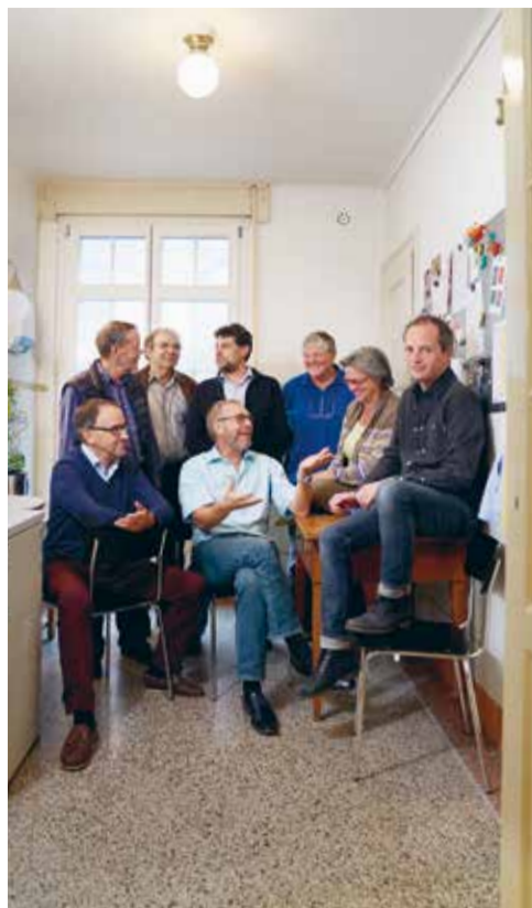
Die Vorstandsmitglieder und der Geschäftsführer des Vereins Casanostra

Mitgliederzahl und Anzahl Vorstandsmitglieder: 7 Geschäftsstelle: 11 Mitarbeiter(innen), 1 Lernender Gegründet: 1990 Mitgliederbeitrag: Keiner, Spenden erwünscht → www.casanostra-biel.ch